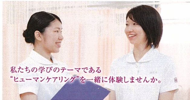
私たちの学びのテーマである 「ヒューマンケアリング」を一緒に体験しませんか。